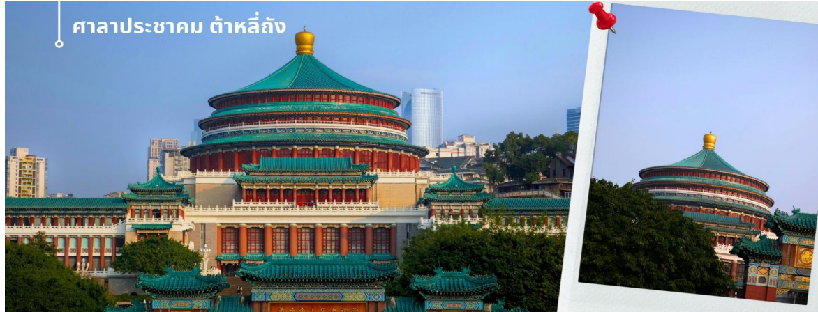
ศาลาประชาชน ต้าหลี่ถิง

ในตอนเย็นและตอนกลางคืนจะมีผู้คนจำนวนมากเข้ามาชมด้วยกันทำกิจกรรม ไม่ว่าจะเป็นการเต้นแอโรบิค เดินเล่น ปิกนิก เดินชมแสงไฟยามค่ำคืน จัดนิทรรศการต่างๆ