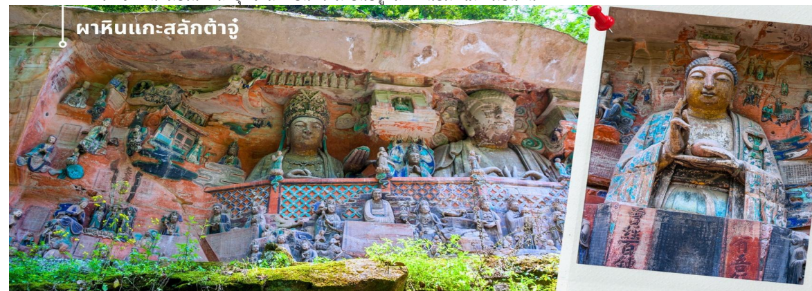
ผาหินแกะสลักต้าจู๋

เช้า รับประทานอาหารเช้า ณ ห้องอาหารของโรงแรมที่พัก (5) นำท่านเดินทางสู่ เมืองต้าจู๋ (ใช้เวลาเดินทางประมาณ 2 ชั่วโมง) จากนั้นนำท่านเดินทางสู่ ผาหินแกะสลักต้าจู๋ เขาเป่าตั้งซาน ผาหินแกะสลักที่ได้รับการบันทึกให้เป็นมรดกโลกทาง วัฒนธรรม ที่ผสมผสานบนความเชื่อด้านศาสนาและเป็นงานศิลปะที่ผสมผสาน จุดเด่นของเมืองต้าจู๋ที่แสดงถึงงานฝีมือใน การแกะสลักถ้ำและผาหิน กลุ่มผาหินแกะสลักต้าจู๋นั้นมีมากกว่า 70 จุด ชิ้นงานมากกว่า 1 แสนชิ้น ในนั้นถือว่าเป็น “เป่าตั้ง ซาน” และ “เป่ยซานม่อหย่า” สองสถานที่ที่มีหินแกะสลักชิ้นชื่อมากที่สุด เน้นไปทางพุทธศาสนาเป็นแบบอย่างของถ้ำหิน แกะสลักของประเทศจีนในยุคศิลปะตอนปลาย และ หินแกะสลักเป่าตั้งซาน เป็นตัวหลักในการขุดเจาะแกะสลักอย่าง ยากลำบากกว่า 70 กว่าปี หินแกะสลักที่นี้จะแกะตามรูปลักษณ์ของตัวภูเขา ด้วยความปราณีต และพิถีพิถัน มีความ สวยงามเทียบพร้อมด้วยเนื้อหาลอกเล่าและเตือนสติผู้พบเห็น และยังมีการจัดแบ่งงานฝีมือของแต่ละยุคไว้ เป็นการประชัน ของช่างในแต่ละยุค ด้านใต้จะเป็นงานในยุคถึงตอนปลาย จนถึง ยุคห้ารัชกาล และ ด้านเหนือจะเป็นงานในสมัย ช่งเหนือซึ่ง ได้ ซึ่งงานฝีมือในแต่ละยุคจะสะท้อนความเป็นอยู่และค่านิยมที่ไม่เหมือนกัน