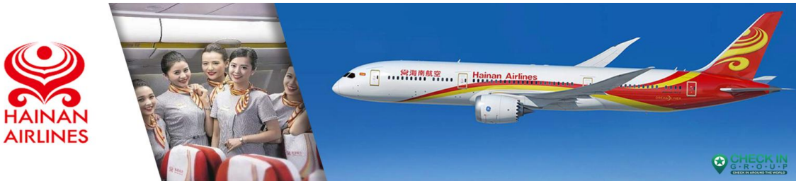
CHUCKG3 ฉงชิ่ง อุ๋หลง หลุมฟ้า ตำบล หยงหยาดัง 5 วัน 4 คืน บิน HAINAN AIRLINES (HU)

วันแรก สนามบินสุวรรณภูมิ - สนามบินฉงชิ่ง เจียงเป่ย์ - รับประทานอาหารเย็น - เข้าโรงแรมที่พัก 08.30 น. คณะพร้อมกัน ณ สนามบินสุวรรณภูมิ ชั้น 4 เคาน์เตอร์ สายการบิน Hainan Airlines (HU) ให้นักานแอร์ไลน์ โดยมีเจ้าหน้าที่ของบริษัทฯ คอยอำนวยความสะดวกให้แก่ท่านก่อนเดินทางขึ้นเครื่อง