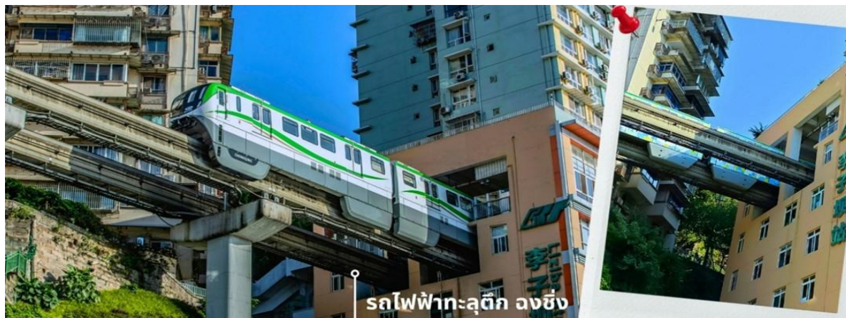
รถไฟฟ้าทะเลตึก ลงชิง

จากนั้นนำท่านนั่งรถไฟฟ้าทะเลตึก หรือ สถานี Liziba เป็นสถานีรถไฟฟ้าแบบขานชาลา สิ่งที่ทำให้สถานี Liziba มีชื่อเสียงไปทั่วโลกคือ “เส้นทางรถไฟที่วิ่งทะลุผ่านอาคารสูง 19 ชั้น” โดยมีระบบลดเสียงและแรงสั่นสะเทือน ทำให้ผู้ที่อาศัยอยู่ในตึกไม่ได้รับผลกระทบจากเสียงดังมาก กลายเป็นภาพอันน่าตื่นตาตื่นใจของผู้ที่มาเยือนทั้งนักท่องเที่ยวที่เดินทางมาเป็นครั้งแรก ผู้โดยสารบนขบวนรถไฟและผู้เข้าชมจากจุดชมวิวก็ต่างตื่นตะลึงไปตามๆกันกับการที่ได้เห็นรถไฟวิ่งทะลุตึกนี้ สถานี Liziba ได้รับการยกย่องให้เป็น 1 ในสถานที่สำคัญที่สะท้อนความเติบโตของจีนตลอด 70 ปี ซึ่งไม่ได้เกิดขึ้นโดยบังเอิญ รถไฟฟ้าทะเลตึกนี้คือตัวอย่างของความอัจฉริยะในการออกแบบการคมนาคมในเมืองภูเขาแห่งนี้ให้ท่านได้สัมผัสประสบการณ์กับการขึ้นนั่งบนรถไฟเพื่อผ่านทะเลตึกและเก็บภาพบรรยากาศ